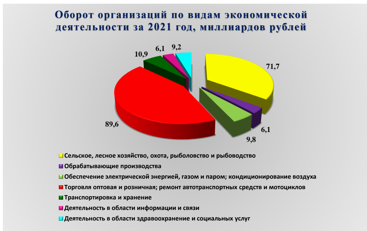
Рис. 1. Оборот организаций по видам экономической деятельности за 2021 год, млрд. рублей

За 2021 год оборот организаций городского округа по всем видам экономической деятельности в действующих ценах составил 220 227,000 миллионов (далее – млн.) рублей, что на 15,9 % выше уровня предыдущего года. Из общего объема оборота организаций на долю организаций оптовой и розничной торговли, ремонта автотранспортных средств и мотоциклов приходится 40,7 %, на долю организаций сельского, лесного хозяйства, охоты, рыболовства и рыбоводства приходится – 32,5 %, на долю промышленных производств – 10,1%, на долю организаций, занимающихся транспортировкой и хранением – 5,0 %.