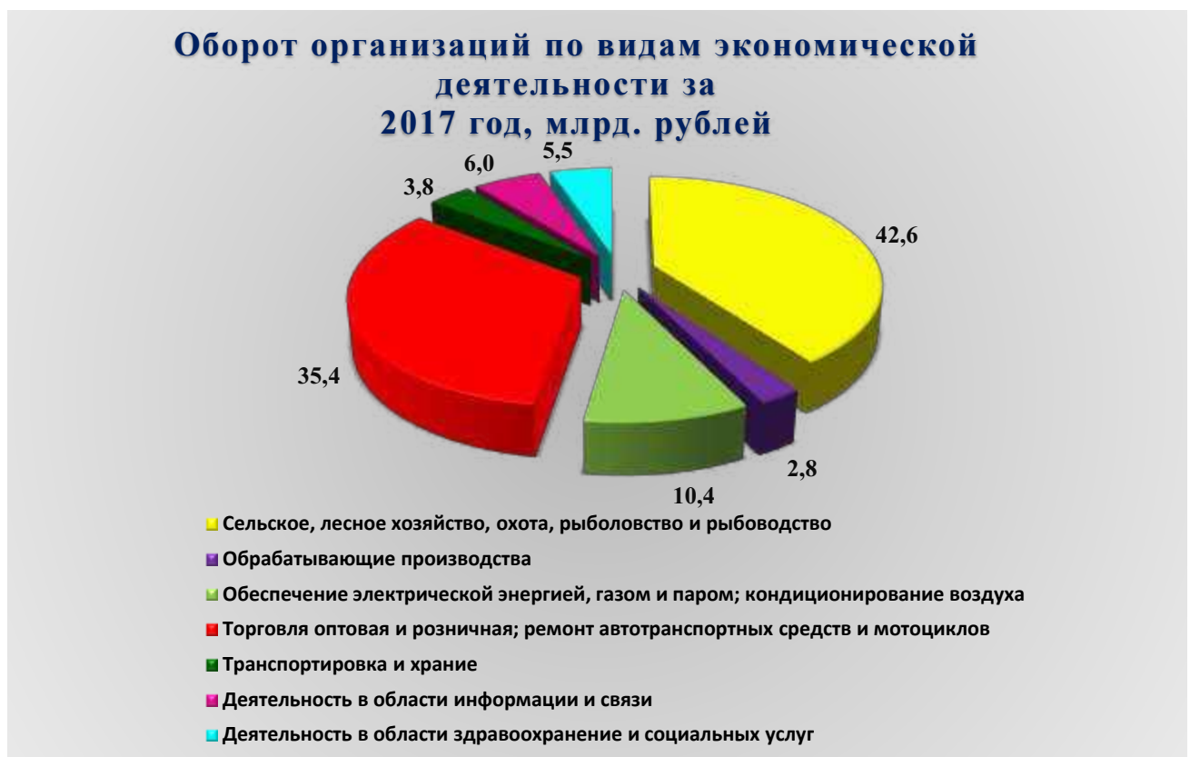
Рис. 1. Оборот организаций по видам экономической деятельности за 2017 год, млрд. рублей

За 2017 год оборот организаций Петропавловска-Камчатского городского округа по всем видам экономической деятельности в действующих ценах составил 116 756,00 млн. рублей, что на 11,9 % выше уровня предыдущего года. Из общего объема оборота организаций на долю организаций сельского, лесного хозяйства, охоты, рыболовства и рыбоводства приходится 36,5 %; на долю организаций оптовой и розничной торговли, ремонта автотранспортных средств и мотоциклов – 30,3 %; на организации, занятые обеспечением электроэнергией, газом и паром, кондиционированием воздуха – 8,9 %.