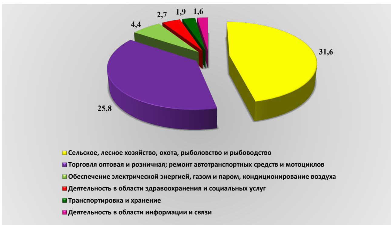
Рис. 1. Оборот организаций по видам экономической деятельности за январь – март 2024 года, млрд. рублей

Оборот организаций по видам экономической деятельности за январь – март 2024 года представлен на рисунке (далее – рис.) 1.