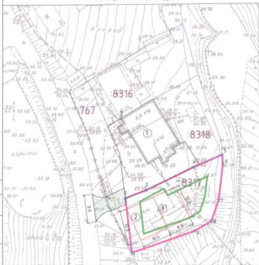
Схема планировочной организации земельного участка после реконструкции