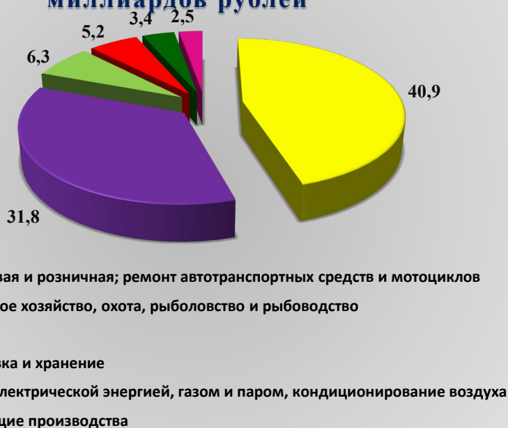
Рис. 1. Оборот организаций по видам экономической деятельности за январь – сентябрь 2022 года, млрд. рублей