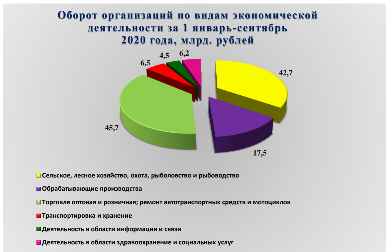
Рис. 1. Оборот организаций по видам экономической деятельности за январь-сентябрь 2020 года, млрд. рублей

В январе - сентябре 2020 года оборот организаций Петропавловск-Камчатского городского округа по всем видам экономической деятельности в действующих ценах составил 137 247,4 млн. рублей, что в действующих ценах на 18,6 % выше уровня аналогичного периода предыдущего года. Из общего объема оборота организаций на долю организаций оптовой и розничной торговли, ремонта автотранспортных средств и мотоциклов приходится 33,3 %, на долю организаций сельского, лесного хозяйства, охоты, рыболовства и рыбоводства – 31,1 %, на организации обрабатывающих производств – 12,8 %.