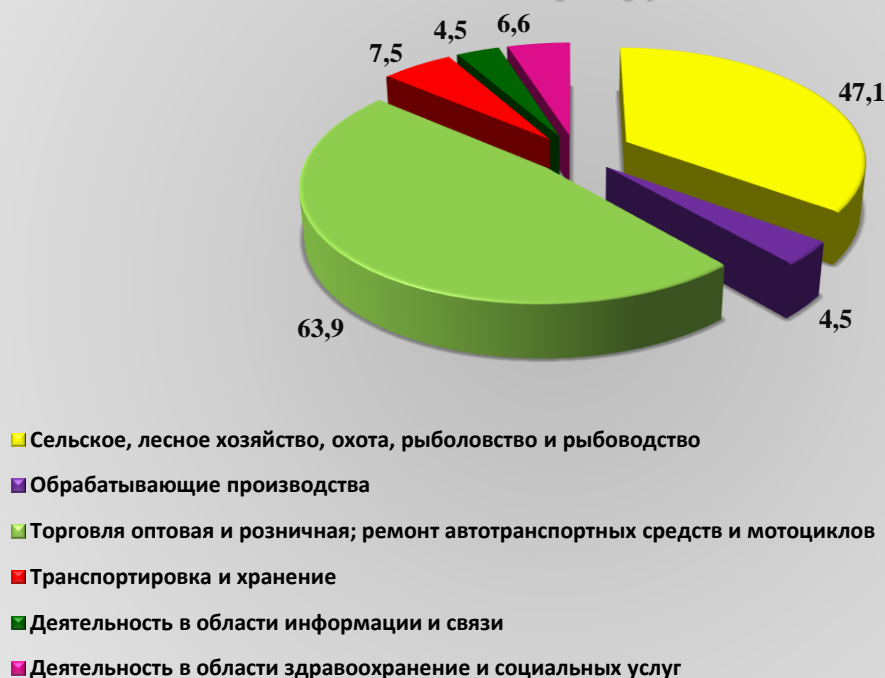
Рис. 1. Оборот организаций по видам экономической деятельности за январь-сентябрь 2021 года, млрд. рублей