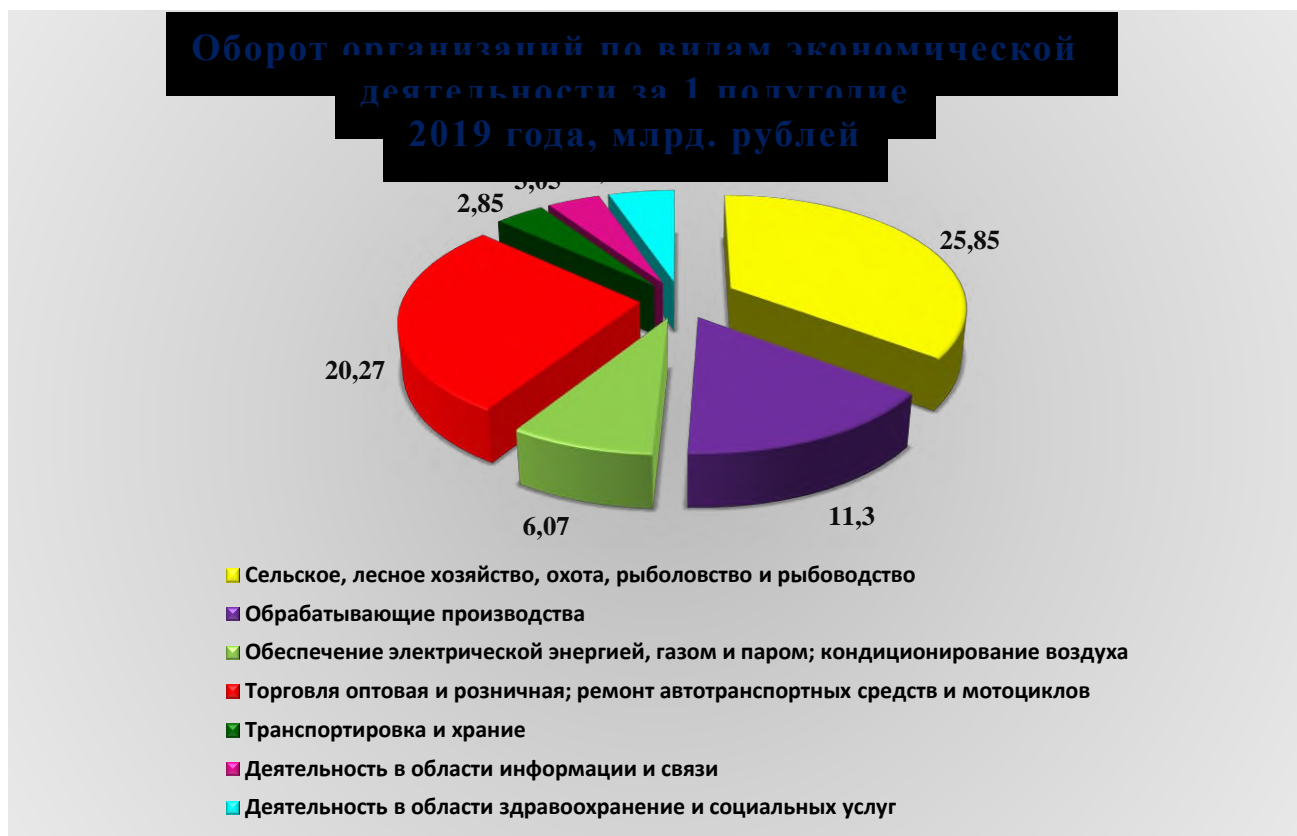
Рис. 1. Оборот организаций по видам экономической деятельности за 1 полугодие 2019 года, млрд. рублей

В январе - июне 2019 года оборот организаций Петропавловск-Камчатского городского округа по всем видам экономической деятельности в действующих ценах составил 77 899,0 млн. рублей, что в действующих ценах на 21,5 % выше уровня предыдущего года. Из общего объема оборота организаций на долю организаций сельского, лесного хозяйства, охоты, рыболовства и рыбоводства приходится 33,2 %; на долю организаций оптовой и розничной торговли, ремонта автотранспортных средств и мотоциклов – 26,0 %; на организации обрабатывающих производств – 14,5 %, на организации занятые обеспечением электроэнергией, газом и паром; кондиционированием воздуха – 7,8 %.