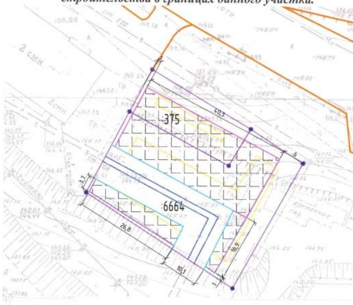
Схема участка, на котором предполагается строительство и размещения предполагаемого к строительству объекта капитального строительства в границах данного участка.