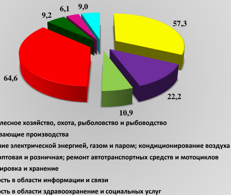
Рис. 1. Оборот организаций по видам экономической деятельности за 2020 год, млрд. рублей

Сокращение оборота по сравнению с 2019 годом отмечается в следующих видах деятельности: